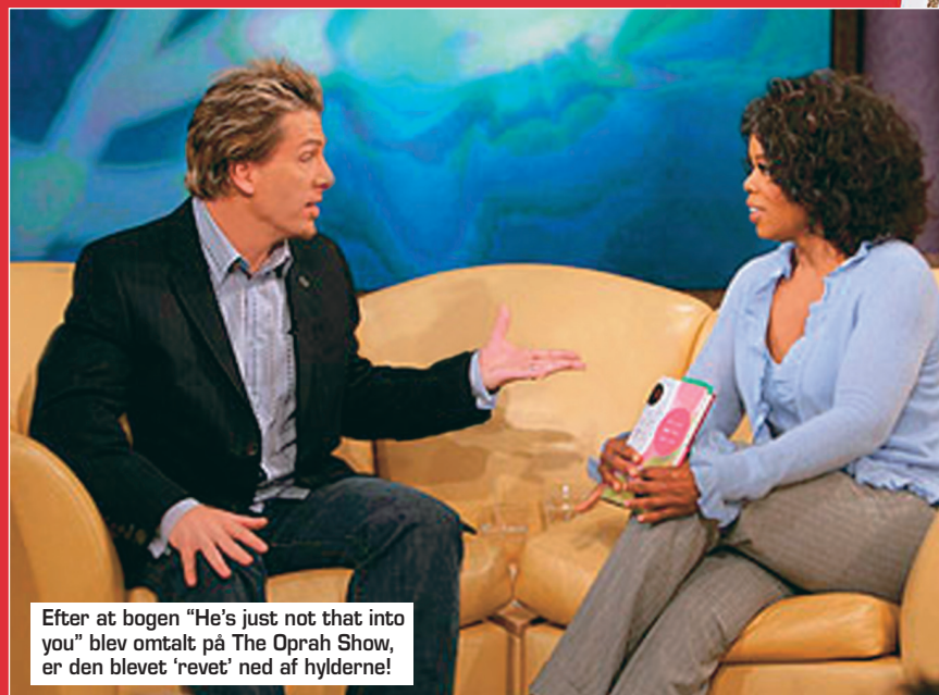
Efter at bogen "He's just not that into you" blev omtalt på The Oprah Show, er den blevet 'revet' ned af hyldeerne!