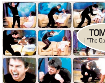
TOM CRUISE i "The Oprah Winfrey Show"

Forelskelses-hormonerne holder i ca. tre måneder, og derefter skal vi selv gøre en større indsats for at bevare gnisten. Vi var mange, der har grinte, da den ellers så kontrollerede Tom Cruise hoppede af glæde over sin nyfundne kærlighed til Katie Holmes i "The Oprah Winfrey Show".